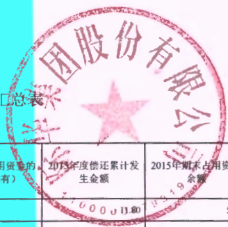
上市公司2015年度非经营性资金占用及其他关联资金往来情况汇总表